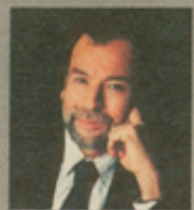
Nelson Ávila Senador del Partido Radical Social Demócrata