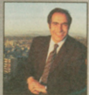
Francisco Chahuán Diputado de Renovación Nacional