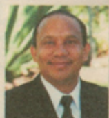
Sixto Porras Presidente Organización Internacional Enfoque a la Familia